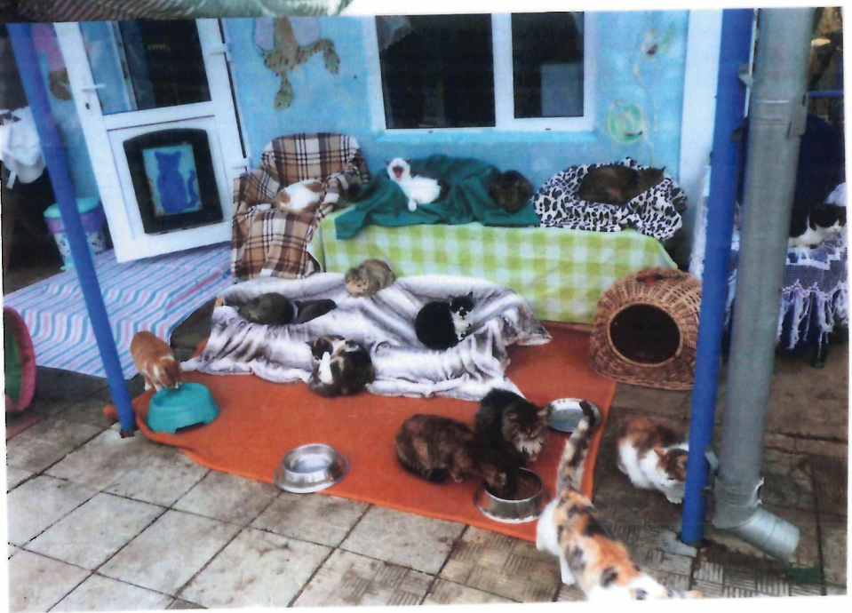
Unser schöner Carmen-Katzengarten