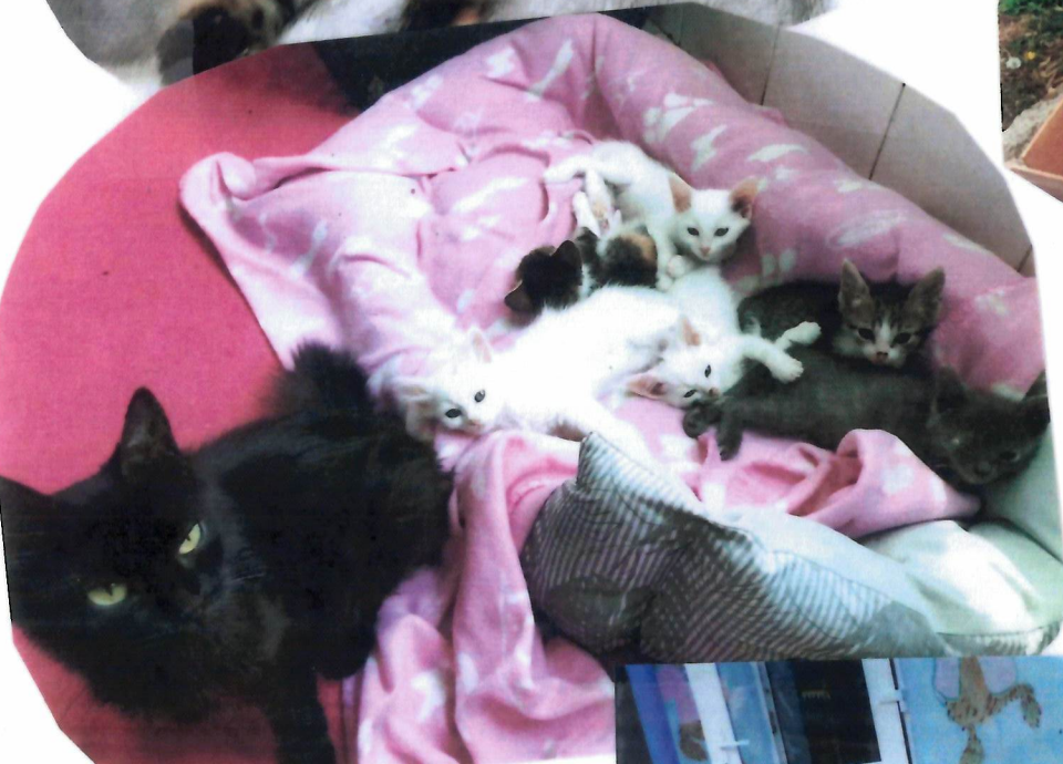
Mama Tina brachte ihre eigenen Babys bei uns zur Welt und adoptierte noch weitere Kätzchen aus dem Müll